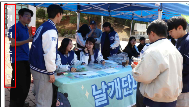
좌측 상단 배치