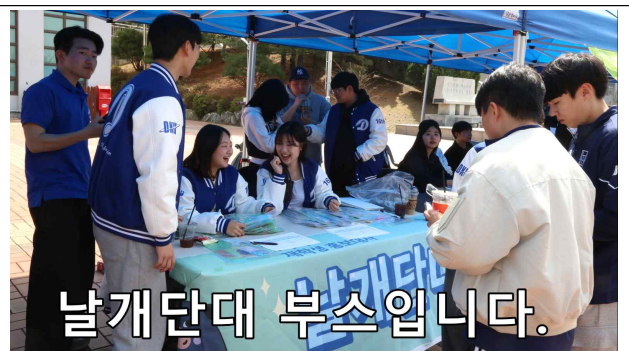
외곽선 효과 사용 후