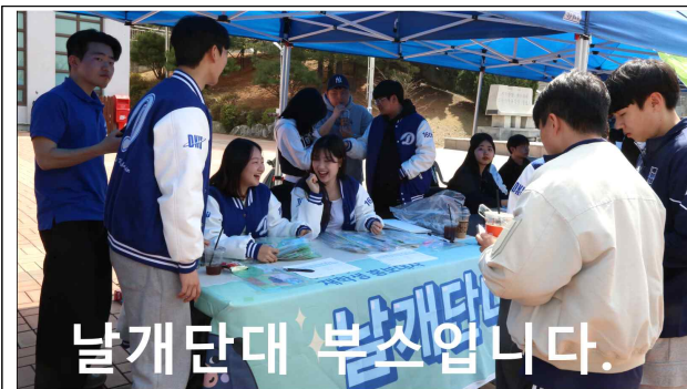
효과 사용 전