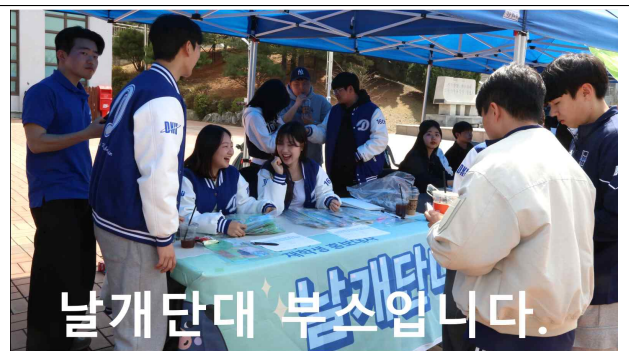
가운데 하단 배치