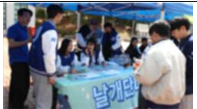
잘못된 예(낮은 화질)