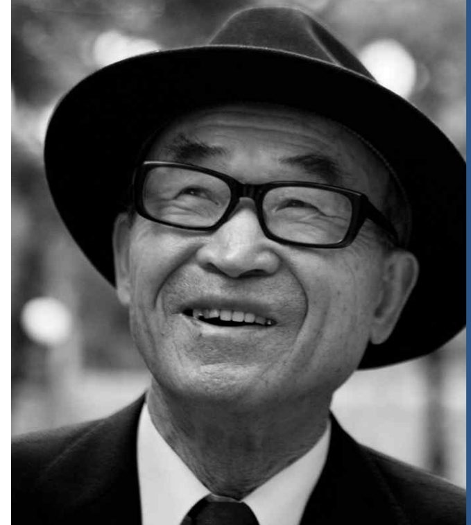
고은 Ko Un