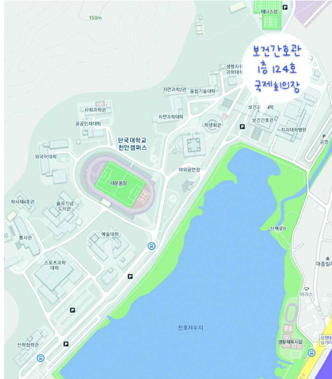
단국대학교 천안캠퍼스 보건간호관 1층 124호 국제회의장