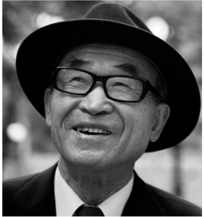
고은 Ko Un

시인, 캘리포니아대학교 버클리캠퍼스 석좌교수 시인. 1941년 미국 출생. 전미도서상과 풀리처상 등 다수의 문학상을 수상. 미국 계관시인 활동. 시집 『인간의 소망 Human Wishes』(1989), 『나무 아래 태양 Sun Under Wood』(1996), 『형식에 관한 작은 책: 시의 형식적 상상력으로서의 탐험 A Little Book on Form: An Exploration Into the Formal Imagination of Poetry』(2017) 등. 캘리포니아 버클리대 석좌교수.